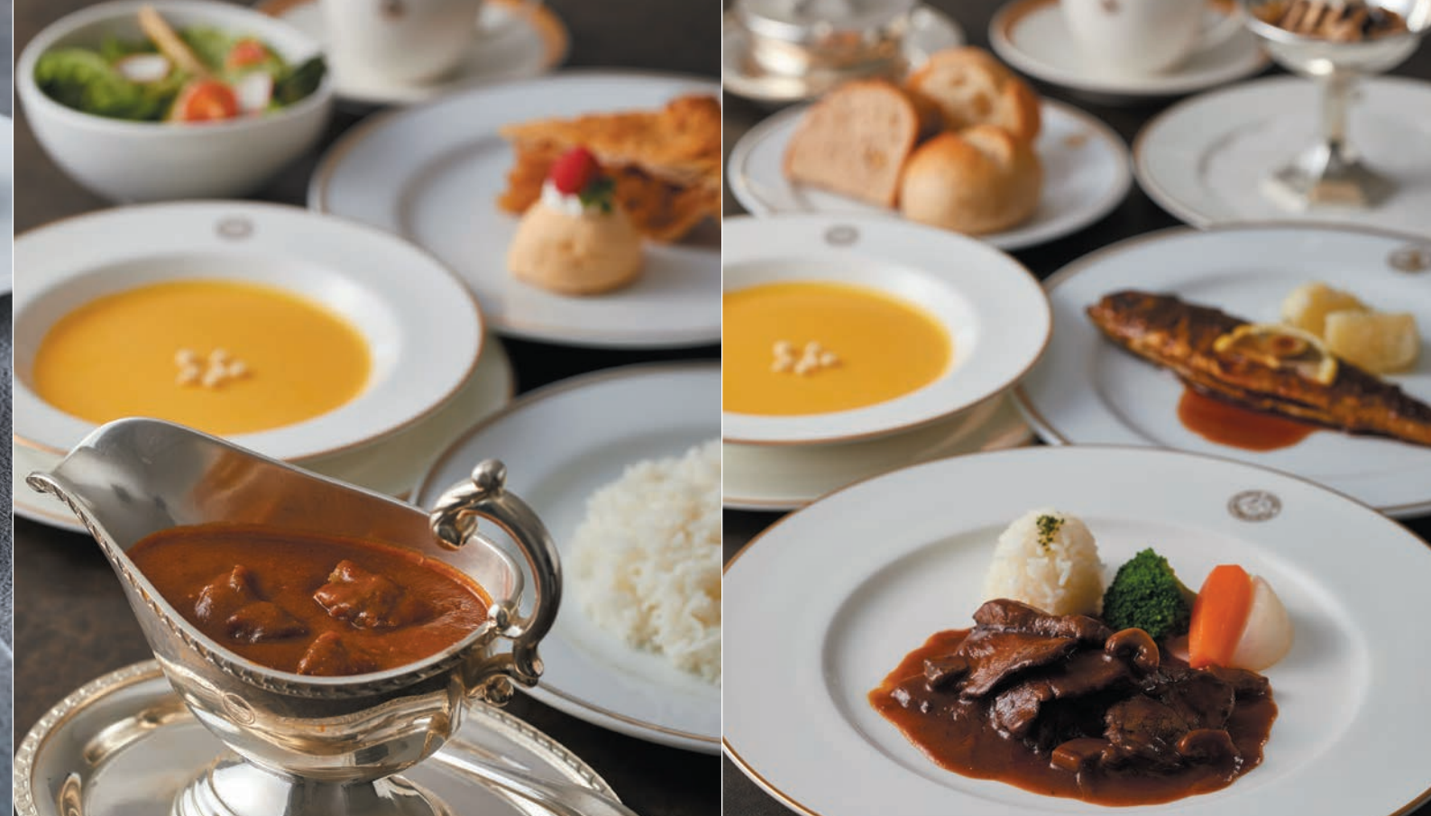
グループランチ【洋食】