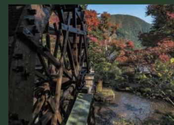
季節の花々がありなす箱根の四季をお楽しみいただける約5,000坪の庭園。