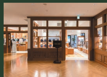
「ホテル・ショップ」ではレトルトカレーなどお土産におすすめの富士屋ホテルオリジナル商品をご用意しております。