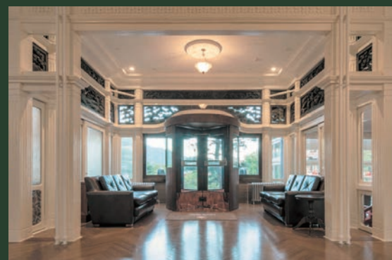
明治24年(1891年)築の本館ロビー階の回転扉。ロビー周辺では尾長鶏の彫刻など様々な装飾がご覧いただけます。