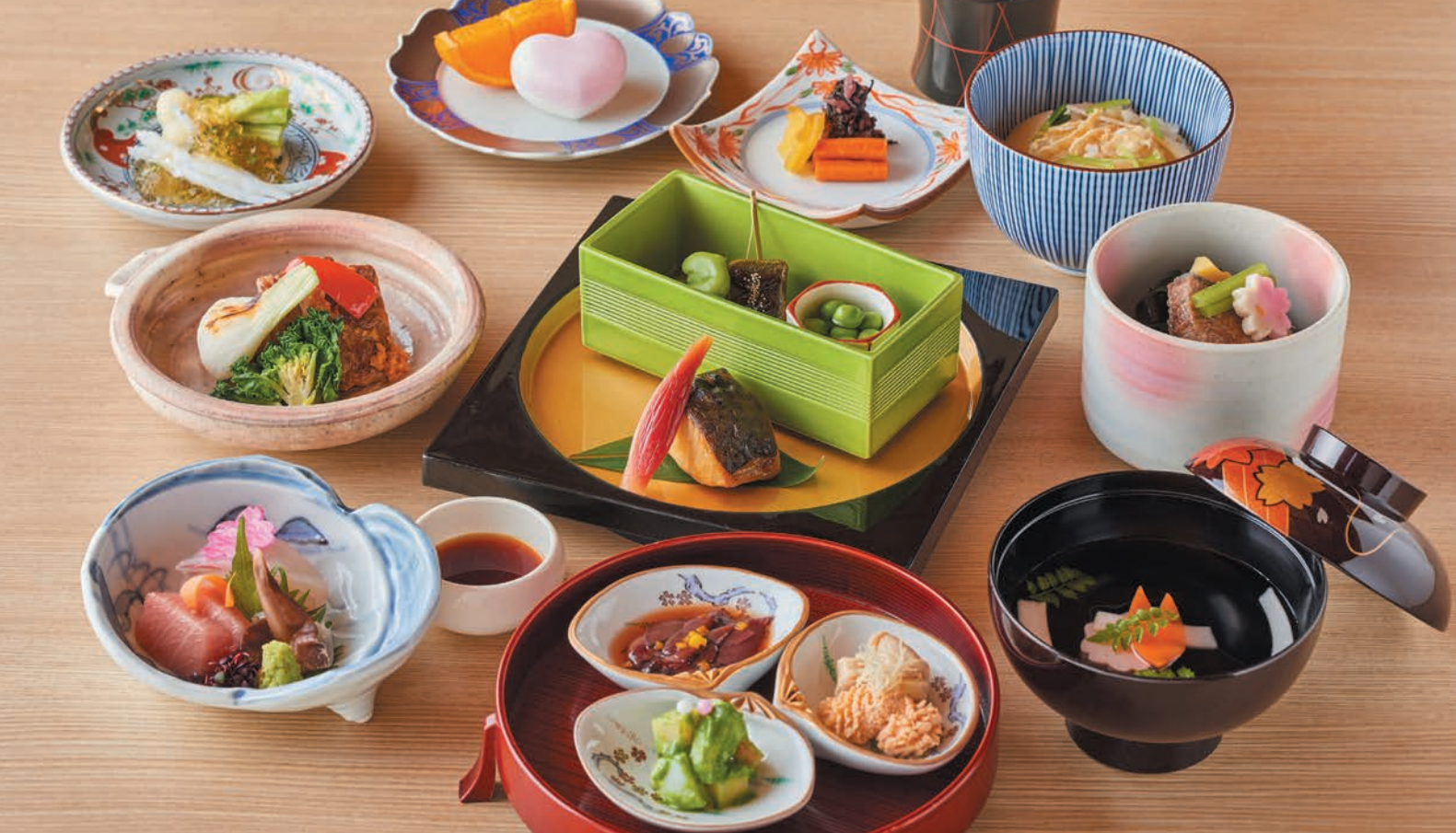
グループランチ【日本料理】