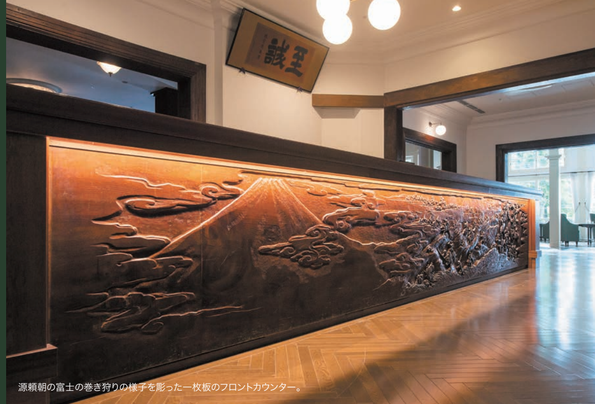
源頼朝の富士の巻き狩りの様子を彫った一枚板のフロントカウンター。