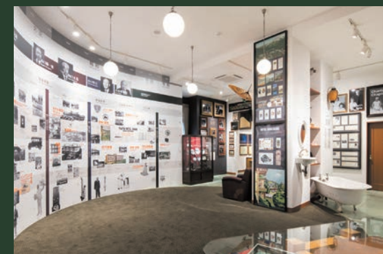
富士屋ホテルの誕生から現在までの道のりを貴重な史料とともにご紹介するホテル・ミュージアム。