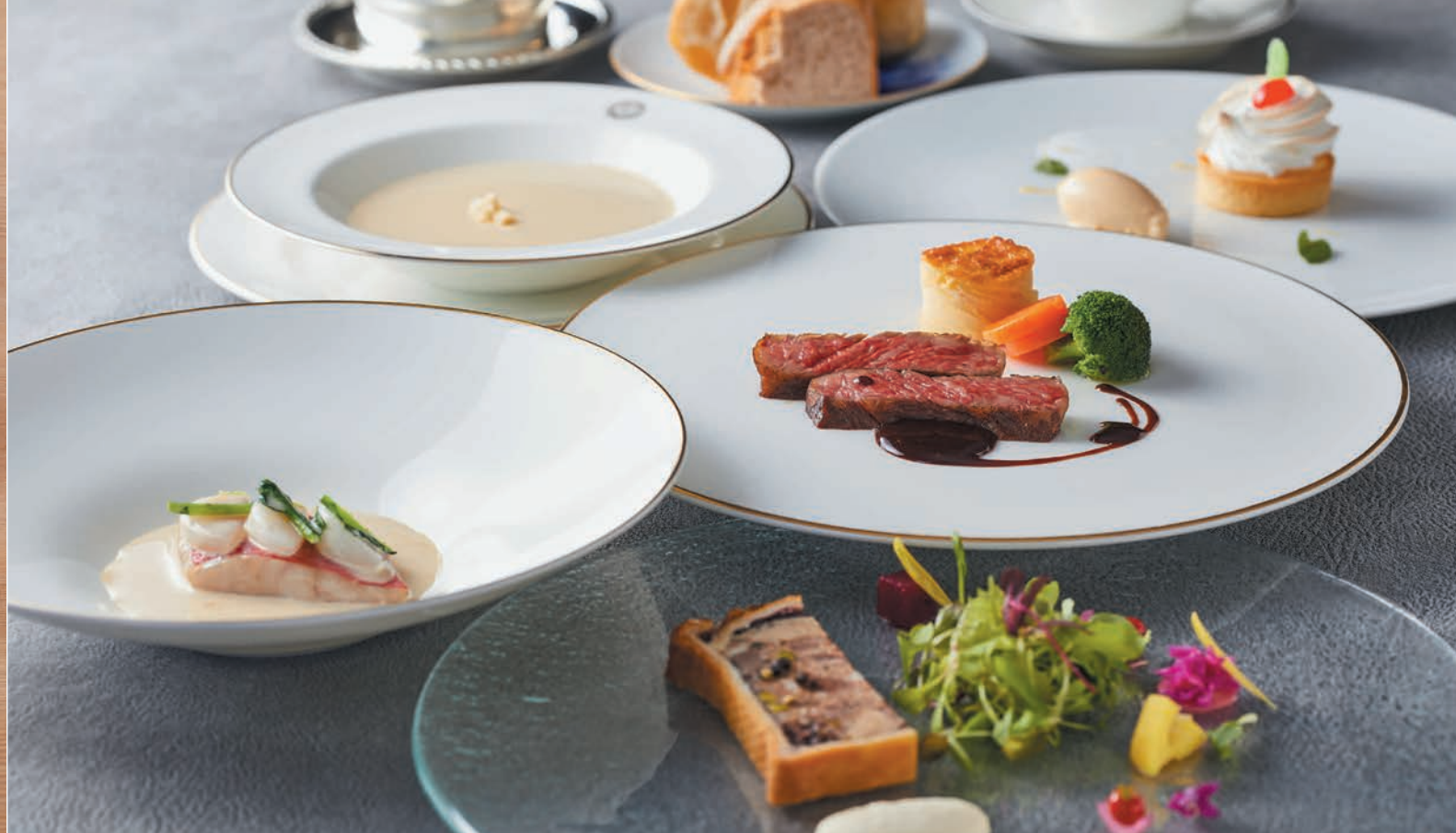
グループランチ【フランス料理】