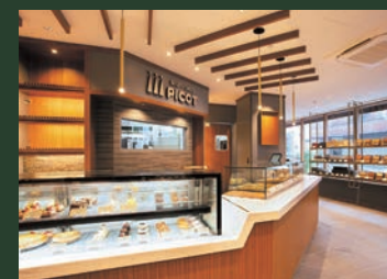
富士屋ホテルのホームメイドのパンやスイーツをお買い求めいただける「ベーカリー&スイーツ ピコット」。