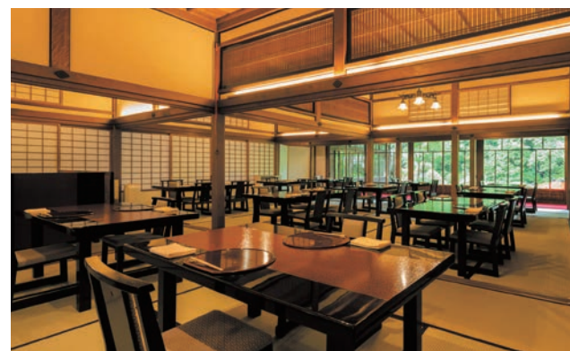
旧御用邸 菊華荘 【日本料理】