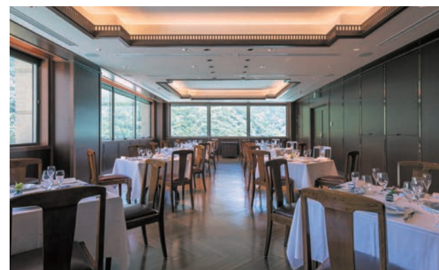
ヘンリーズ・ルーム 【フランス料理】